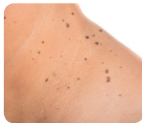
Pete ale pielii